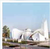
H.H. Andreas, Petrus en Paulus