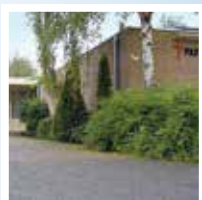
Willibrord, Pax Christikerk