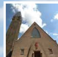
H. Hart van Jezus