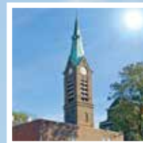
Willibrord, H. Lucaskerk