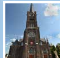
St. Liduina - OLV. Rozenkrans

De volgende Kerk aan de Waterweg verschijnt rond 21 februari 2020 Kopij graag inleveren voor 20 januari 2020