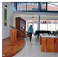
St. Jan de Doper-Visitatie