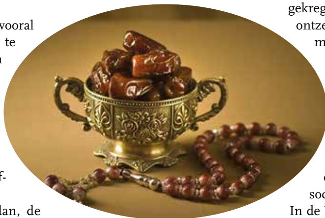
Traditioneel worden in de Ramadan bij het breken van het vasten dadels gegeten.

In de Veertigdagentijd zullen wij in de drie steden binnen onze parochie stilstaan bij vasten in verschillende tradities. (zie hiervoor het overzicht elders in dit nummer van Kerk aan de Waterweg .) Ik hoop dat het een vruchtbare uitwisseling mag worden, die veel mensen zal inspireren tot een tijd van bezinning en tot solidariteit. 🙏