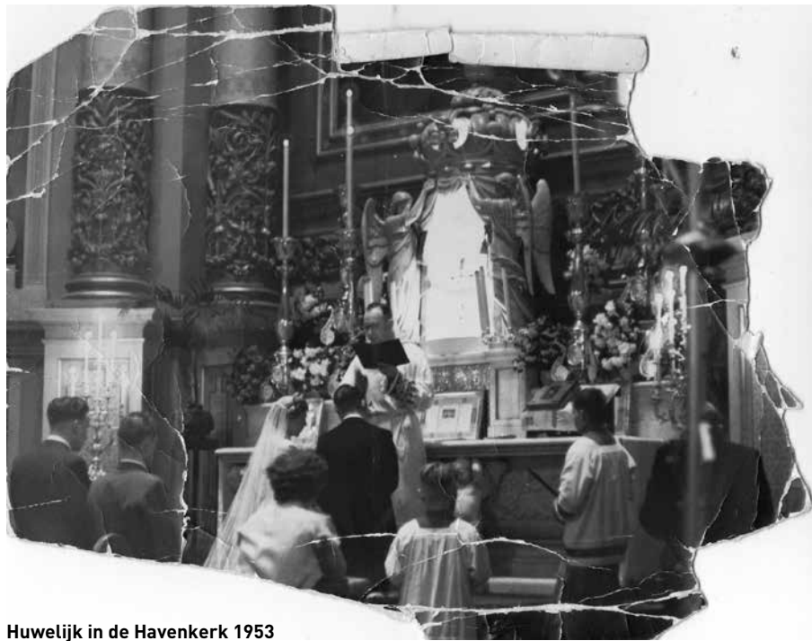
Huwelijk in de Havenkerk 1953

We gingen in Vlaardingen wonen en er kwamen drie zoons. Eerst was er de noodkerk in de Van Hogendorpstraat. Toen werd er een grote kerk gebouwd, de Heilige Geest, pastoor