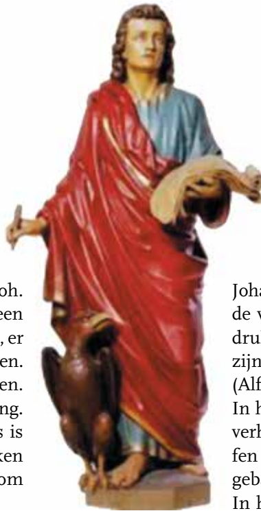
Johannes de evangelist met een adelaar als symbool.

IK BEN de Opstanding en het Leven (Joh. 11,25). Jezus bracht leven waar mensen op een dood spoor zaten. De dood is niet het einde, er is de opstanding uit de dood naar nieuw leven. IK BEN de Weg, de Waarheid en het Leven. (Joh. 14,6). Jezus is als een weg, geeft richting. IK BEN de Wijnstok (Joh. 15,1). Jezus is als een wijnstok, verbonden met de ranken (wij allemaal). Het contact is wezenlijk om goede vruchten te kunnen dragen.