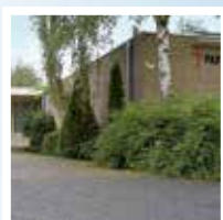
Willibrord, Pax Christikerk