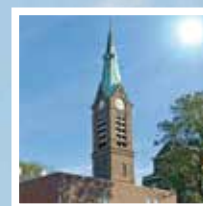
Willibrord, H. Lucaskerk

De volgende Kerk aan de Waterweg verschijnt rond 9 juni. Kopij graag inleveren voor 8 mei 2017.