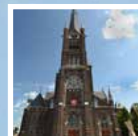
St. Liduina - OLV. Rozenkrans