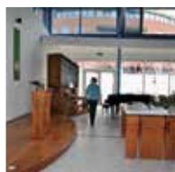
St. Jan de Doper-Visitatie