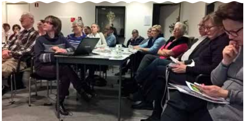
Inspiratievond 40 dagentijd

Week 3 De Glind is een gewoon, klein, groen dorp in de gemeente Barneveld. Bijzonder wordt het pas als je weet dat er achter 25 van de 140 voordeuren een professioneel gezinshuis zit. Kinderen en jongeren die uit huis geplaatst zijn, kunnen hier wonen en werken aan hun toekomst. De Rudolphstichting ontwikkelt er vernieuwende zorgprojecten en gezinshuizen.