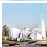
H.H. Andreas, Petrus en Paulus