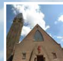
H. Hart van Jezus