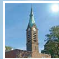
Willibrord, H. Lucaskerk