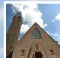
H. Hart van Jezus