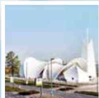
H.H. Andreas, Petrus en Paulus