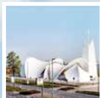
H.H. Andreas, Petrus en Paulus

De volgende Kerk aan de Waterweg verschijnt rond 23 februari 2018. Kopij graag inleveren voor 22 januari.