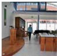
St. Jan de Doper-Visitatie