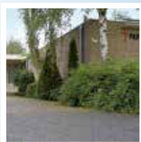
Willibrord, Pax Christikerk

De volgende Kerk aan de Waterweg verschijnt rond 23 februari 2018. Kopij graag inleveren voor 22 januari.