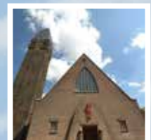
H. Hart van Jezus