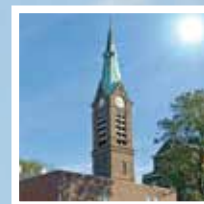
Willibrord, H. Lucaskerk